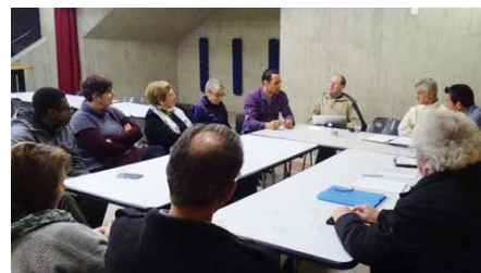
Rencontre avec les conseils de Port-Valais.

Autant la soirée paroissiale de mardi à Port-Valais, la soirée œcuménique de mercredi, la soirée « enthousiasmante ma