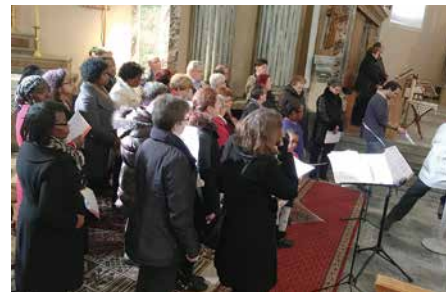
Chœurs Amitié, Cap Verdien et des 3/4h.

Un grand merci à toutes les personnes qui se sont rassemblées et à celles qui nous ont aidés à vivre ces temps forts. Un clin d'œil particulier à la jeunesse de Vionnaz qui est venue en renfort pour la soirée jeunes et pour l'apéro du samedi à Vionnaz !