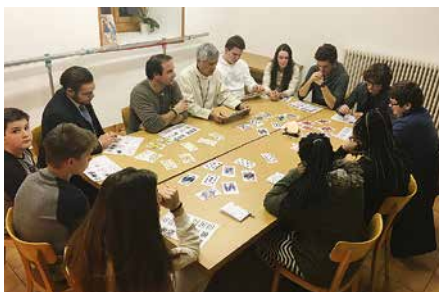
Vendredi soir avec les jeunes.