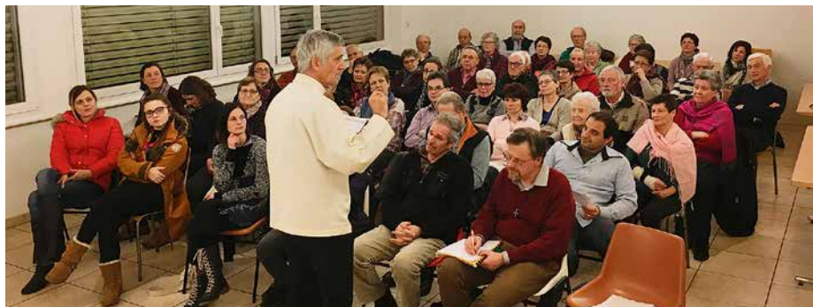
« Enthousiasmante ma paroisse ? » jeudi soir avec les conseils et motivés de Vionnaz, Revereulaz et Vouvry.