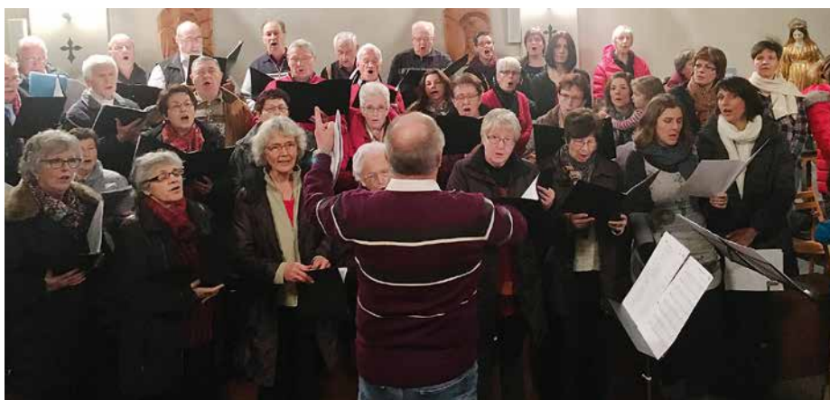
CAL, Graind'Sel, Chœur d'hommes (à la tribune).

Finalement, les célébrations nous ont permis de clôturer cette semaine dignement et nous ont révélé un autre trésor de nos communautés : la joie de la collaboration entre différentes chorales.