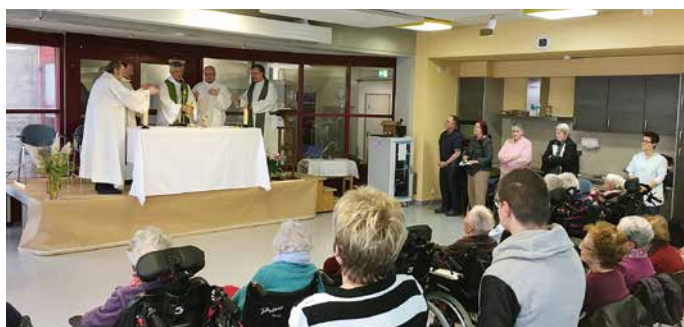
Vendredi rencontre et messe au home Riond Vert.