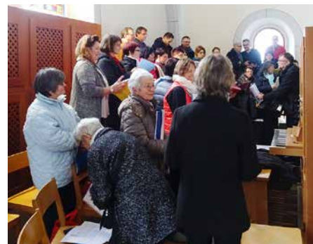
Chœurs du Bouveret et Chœur St-Michel.

l'œcuménisme, chez nous, est une réalité vivante de nos communautés. Il est nourri par les nombreux couples mixtes qui œuvrent à l'unité depuis des décennies et par des chrétiens de diverses confessions engagés dans le monde au nom de leur foi (visite de prisons, aide aux réfugiés, engagement dans les écoles, prière de Taizé...).