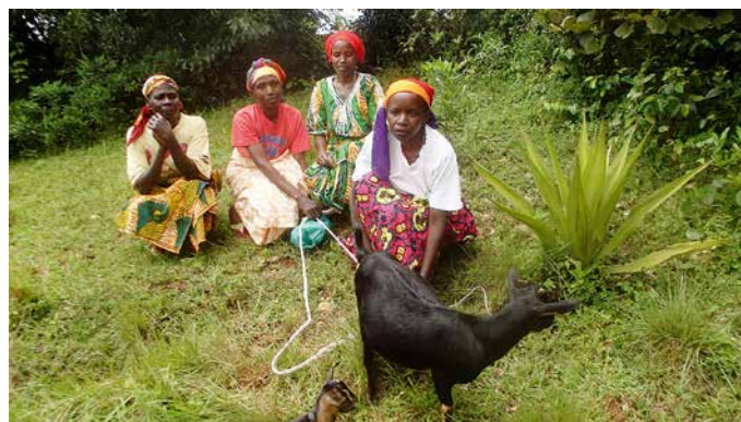
Projet chèvres avec des femmes veuves.