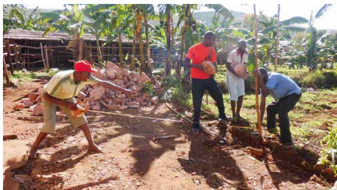
Séminaristes construisant leur nouvelle maison.